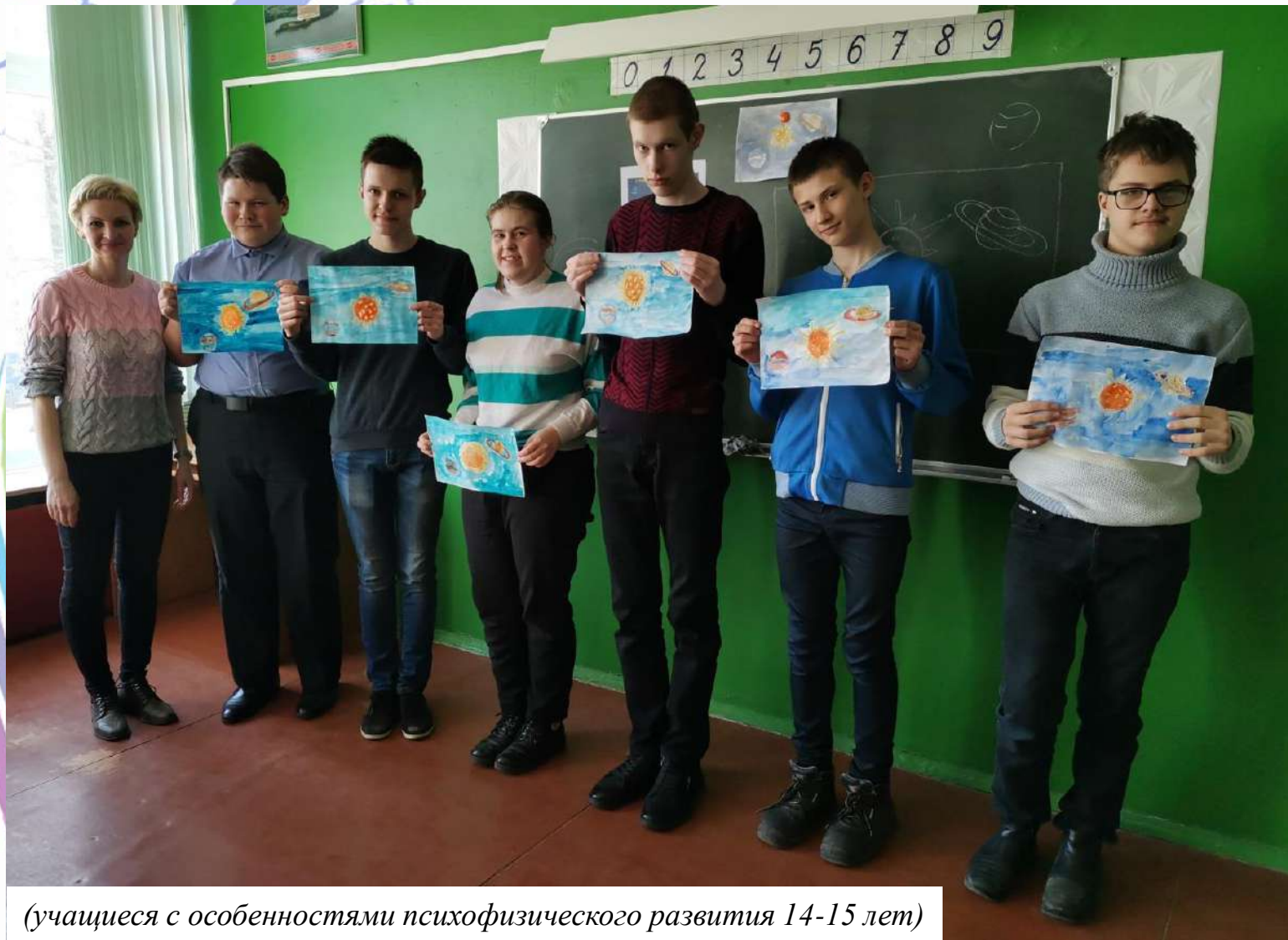
(учащиеся с особенностями психофизического развития 14-15 лет)